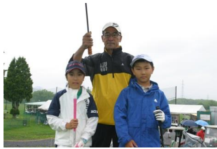
※米倉会長の帯同キャディーです