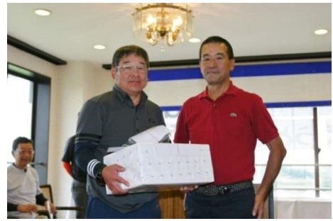
※米倉会長（右側）より贈呈