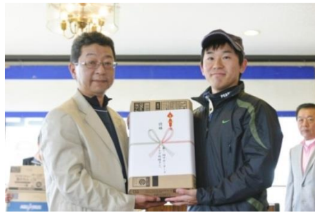
※荒木副会長（左側）より贈呈