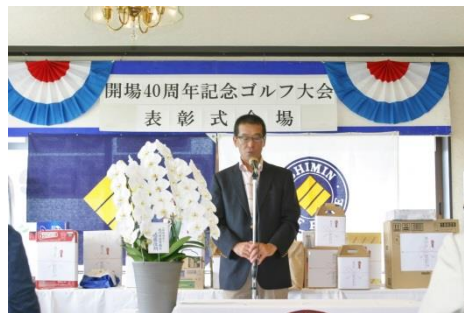
※米倉委員長のあいさつ