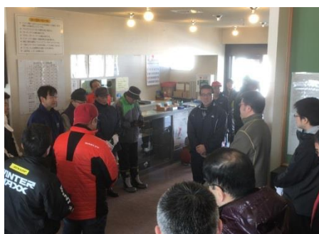
※米倉会長 開始前のあいさつ

当日は天候にも恵まれ、会員の9事業所から、35名の参加があり、2時間ほどの作業で2トントラックと軽トラック30台分の枝等を回収しました。お陰さまを持ちまして、4月8日に平成20年に次ぐ、コースオープンができました。