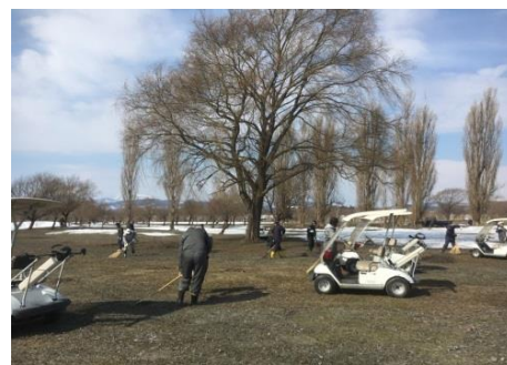
※コース内の枝拾いの様子