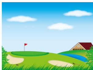
第5回優勝者 (山本 直樹氏)